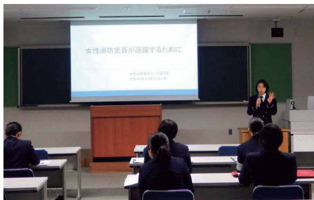
課題研究発表（女性活躍推進コース）