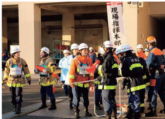
消防活動訓練（女性活躍推進コース）

平成 29 年度からは、女性活躍推進コースの定員を 48 人から 60 人に増員するとともに、教育日数を 5 日間から 7 日間に拡充しているほか、女性の活躍推進をテーマとした「消防大学校フォーラム」を開催している。