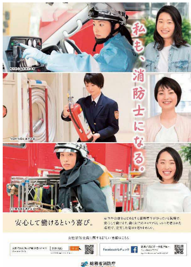
特集 6-2 図 女性消防吏員 PR ポスター

平成 29 年度に引き続き、30 年度も、女性を対象とした消防の魅力伝えるためのポスター（特集 6-2 図）を作成した。また、女子学生等の理解をより深めるため、女性消防吏員のキャリアパス、勤務形態や勤務条件等について具体的事例を用いて示した「女性消防士の WORK+LIFE ガイドブック」を配布した（特集 6-3 図）。