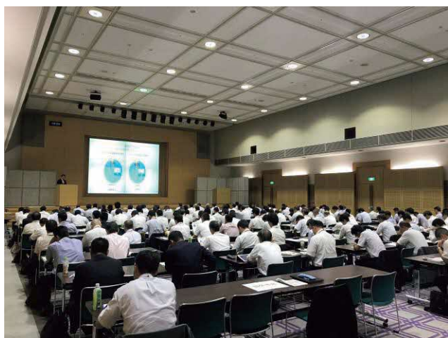
全国説明会東京会場の様子

平成 30 年度は、5 月から 8 月にかけて、全国 7 か所で各消防本部の人事担当幹部等を対象に説明会を開催し、消防本部における女性消防吏員の活躍推進の意義や各消防本部の取組状況等を説明したほか、先進的な取組を行っている消防本部を視察し、女性消防吏員確保のための課題や対策についての意見交換を行った。