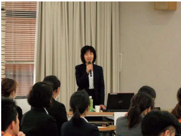
女性消防吏員活躍推進アドバイザー派遣の様子