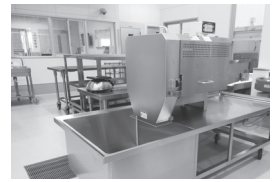
フードスライサー