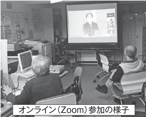
オンライン(Zoom)参加の様子

本大会では、「住民主体の支え合い、安心して暮らせる地域づくり」をテーマに、近畿大学総合社会部の松本行真教授の講演と、苫小牧や千歳、室蘭の各市の町内会組織より、オンライン会議やデジタル回覧板などの導入、更には、自主防災組織の広域化についての先進的な実践報告をいただきました。