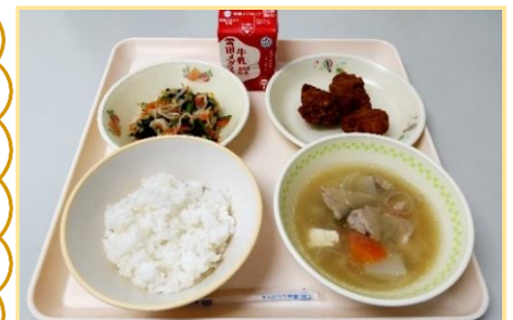
中学校3年生のリクエスト給食(2月9日提供)

日本には昔から「五味五色五法」という料理のことばがあります。色々な味付けでさまざまな調理方法で彩りを考えた食事が理想です。