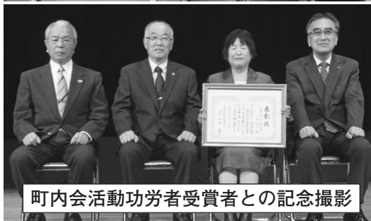
町内会活動功労者受賞者との記念撮影