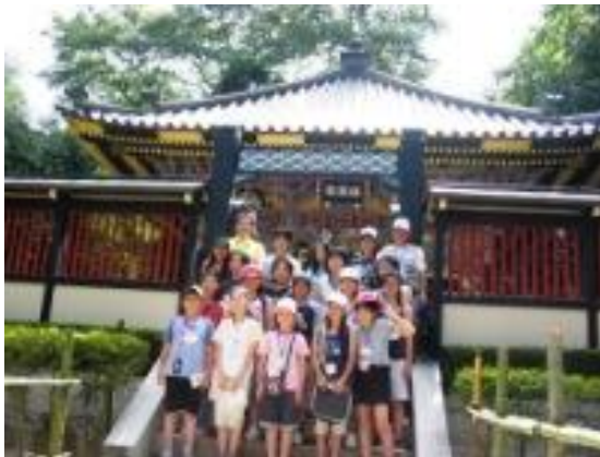
仙台市歴史にふれる旅

歴史的に深いつながりを持つ仙台市とは、昭和56年5月に歴史姉妹都市の提携を結んで以来、姉妹都市交流、スポーツ交流、青少年や高齢者の相互間交流などを進めています。仙台市の有名な七夕飾りや歴史的文化的財の展示など、共通の歴史をもとに、人づくりやまちづくりに生かしています。