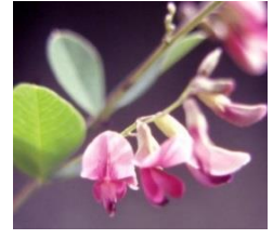
エゾヤマハギ (昭和 53 年制定)