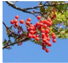
ナナカマド (昭和 52 年制定)