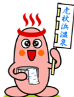
虎杖浜温泉イメージ キャラクター「ゆたら」