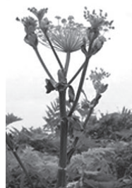
シウキナは夏になると高さ2~3メートルほどに成長し、たくさんの小さな白い花をつける

とある白老アイヌのエカシ（長老）によれば、「昔はよくシウキナを採ってきて、皮をむいて生で食べたもんだ。皮をむく時は根元の切口にマキリ（小刀）で十文字に切れ目を入れ、自分の口の近くへ持って行って「フッサ！」と言ってから食べていた。子どもながらにどうしてそうするのか？その時はわからなかったけれども、真似してやったもんさ…」と言います。シウキナ（和名はエゾニユウ）とはアイヌ語で苦い草を意味し、茎を噛んでみると苦く、匂いはセロリに似ています。エカシによれば、それほど苦かったという記憶はなかったと言い、比較的苦味のないものを選んで食べていたと思われます。また、エカシが語った「フッサ！」と言う動作は、魔よけやお祓いのおまじないとして病人の治療の際などにも行われ、フッフッと息を吹きかける音が「フッサ！」に聞こえるものですが、シウキナの場合は苦味を避けるおまじないであったようです。